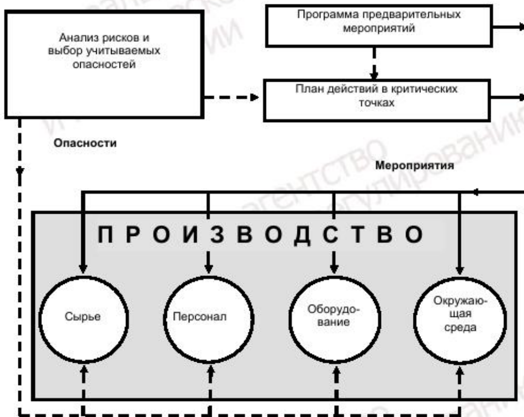
Рисунок 1 — Анализ опасностей и их устранение в процессе производства

2 уровень — это действия в критических контрольных точках, которые с учетом мероприятий 1-го уровня, должны обеспечить устранение или снижение до допустимого уровня всех учитываемых опасных факторов. Данный подход иллюстрируется схемой, представленной на рисунке 1.